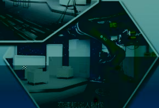
高速机器人操作室